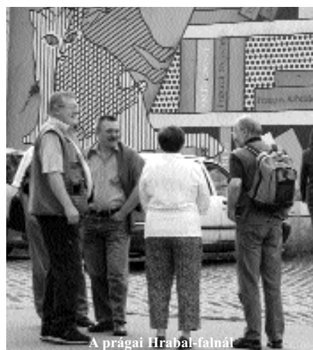
A prágai Hrabal-falnál