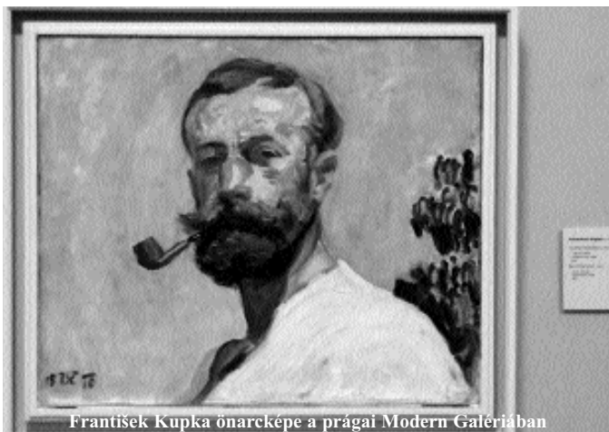
František Kupka önarcképe a prágai Modern Galériában