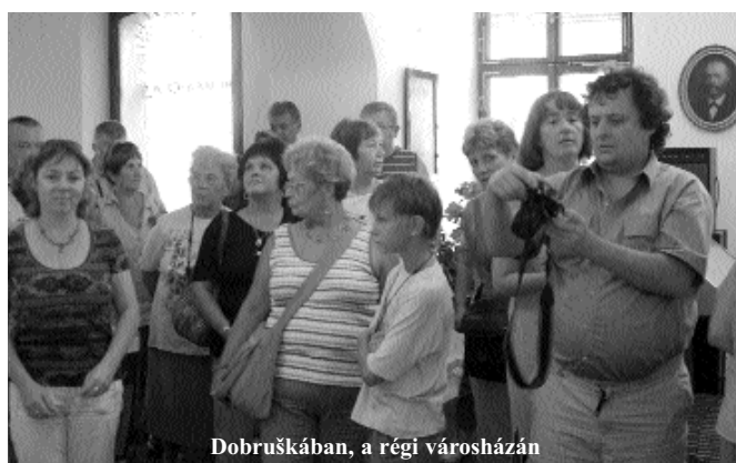
Dobruškában, a régi városházán