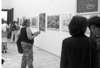
A kiállítás megnyitóján

2007. október 4. – Hivatalosan közzölték, hogy a třebiči születésű tizenöt hónappal korábban elcseréltek két lánycsecsemőt. A szülők az év végéig kicserélték gyermekeiket, és kárpótlást követelnek.