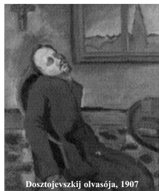
Dosztojevszkij olvasója, 1907

2007. október 21. – Több mint öt hónap után zárt a prágai Jizdárnában Emil Filla, a „cseh Van Gogh” (1882–1953) retro-