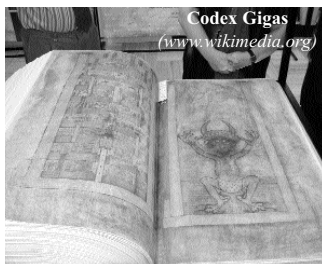
Codex Gigas

2007. szeptember 19. – A prágai Klementinum galériájában 2008. január 6-ig láthatta a közönség a XII–XIII. század fordulóján cseh földön keletkezett Codex Gigas-t, közismertebb nevén a Sátán bibliáját, a világ legnagyobb középkori kéziratos könyvét, amelyet a harmincéves háború végén, 1648-ban vittek magukkal a svédek hadiszármányként. 1649-ben a stockholmi Svéd Királyi Könyvtár gyűjteményébe került, ahol mind a mai napig őrzik. A 624 oldalas óriás föliás 75 kilogrammot nyom. Elkészítéséhez 160 szem bórét használtak fel.