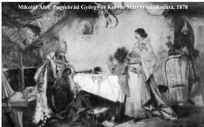
Mikoláš Aleš: Pogyebrád György és Korvin Mátyás találkozása, 1878

2007. december 13. – A prágai Nemzeti Galéria a vár Lovardájában nagyszabású áttekintő kiállítást rendezett 2008. április 20-ig Mikoláš Aleš (1852–1913) cseh festő, rajzoló, illusztrátor alkotásaiából.