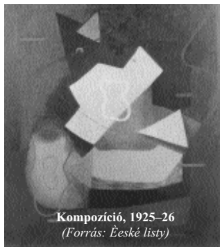
Kompozíció, 1925–26 (Forrás: Ěeské listy)

2007. november 16. – A brnói Morva Galériában nagyszabású kiállítás nyílt 2008. február 17-ig František Foltýn (1891–1976) festő alkotásaiból, akinek neve Kassa–Párizs–Brno városával fonódott össze.