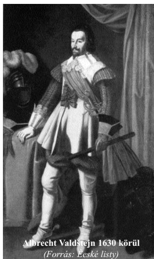
Albrecht Valdštejn 1630 körül

2007. november 15. – A prágai Valdštejn Lovardában „Albrecht Valdštejn (1583–1634) és kora” címmel nyílt látványos sikerkiállítás a híres hadvezér életéről és az akkori katonai, kulturális, művészeti környezetről.