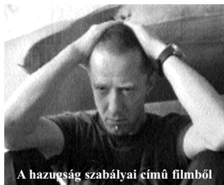
A hazugság szabályai című filmből

2007. november 16–18. – A budapesti Örökmozgó Filmmúzeumban tartott Cseh Filmhévtégen a legfrissebb, a legtöbb díjat nyert, illetve a hazájukban legnépszerűbb cseh játék- és dokumentumfilmeket vetítették, köztük Věra Chytilová Szép pillanatok, Bohdan Sláma Valami boldogság című alkotását és Robert Sedláček A hazugság szabályai című munkáját.