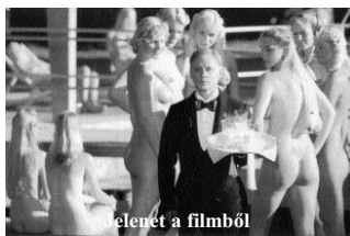
elenet a filmből

2007. augusztus 30. – A Budapesten kezdődött négynapos Moziünnep díszvendége Jiří Menzel cseh filmrendező volt, akinek premier előtt vetítették legújabb játékfilmjét, az Őfelsége pincére volt című Hrabal-adaptációját.