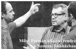
Miloš Forman kftáival rendez a Nemzeti Színházban