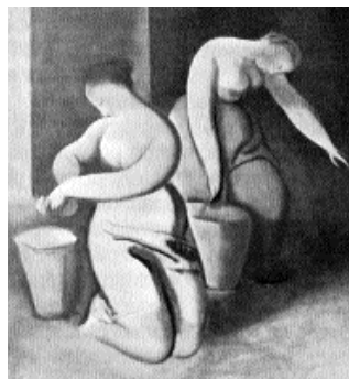
Rudolf Kremlička: Mosónők, 1919

2007. augusztus 3. – A brnói Morva Galéria Rudolf Kremlíčká t (1886–1932), a cseh modern festészet egyik megteremtőjét bemutató életmű-kiállítást rendezett november 4-ig.