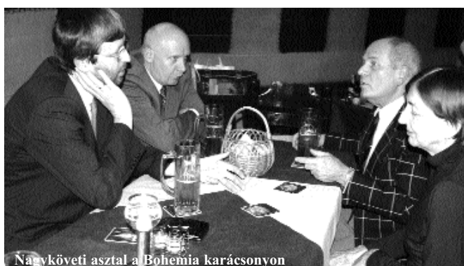
Nagyköveti asztal a Bohemia karácsonyon