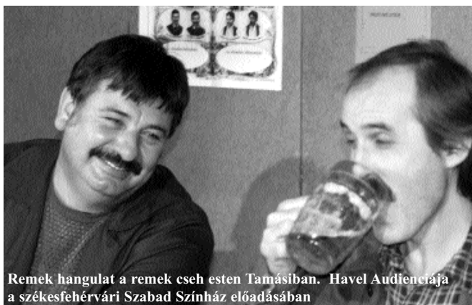
Remek hangulat a remek cseh esten Tamásiban. Havel Audienciaja a székesfehérvári Szabad Színház előadásában