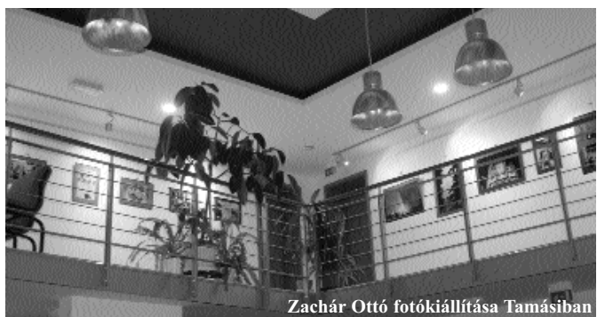
Zachár Ottó fotókiállítása Tamásiban