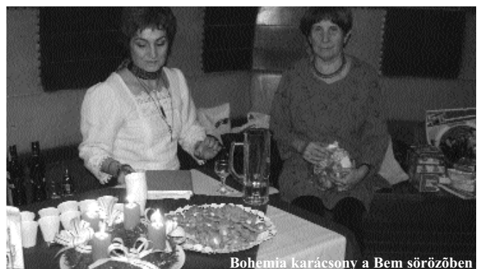
Bohemia karácsony a Bem sörözőben